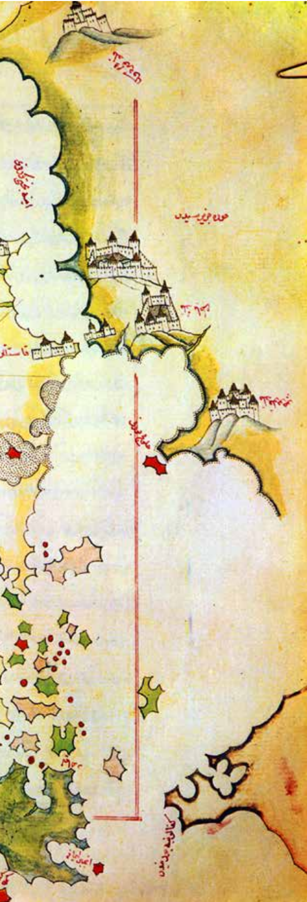
< Kitab-ı Bahriye'de yer alan İnebahtı, Narde, Mora'yı gösteren harita