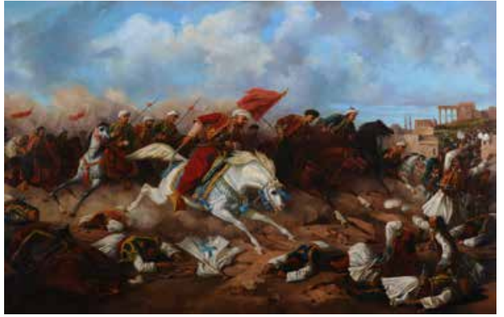
^ Mora İřyanı'nı tasvir eden tablo

Kaynaklar: Justin McCarthy, Ölüm ve Sürgün, Osmanlı Müslümanlarına Karřı Yürütölen Ulus Olarak Temizleme İřlemi, 1821-1922, İstanbul 1998; Mustafa Turan-Musa Gürbüz, "Yunan Bağımsızlık Düşüncesinin Tarihi Temelleri ve Tripoliçe Katliamı", Uluslararası Suçlar ve Tarihi, S.1, 2006; Nurettin Türsan, Mora Ayaklanmaları ve Yunan Bağımsızlığı, İstanbul 1994; Salahi R. Sonyel, "Yunan Ayaklanması Günlerinde Mora'daki Türkler Nasıl Yok Edildiler?", Belleten, 233/1998.