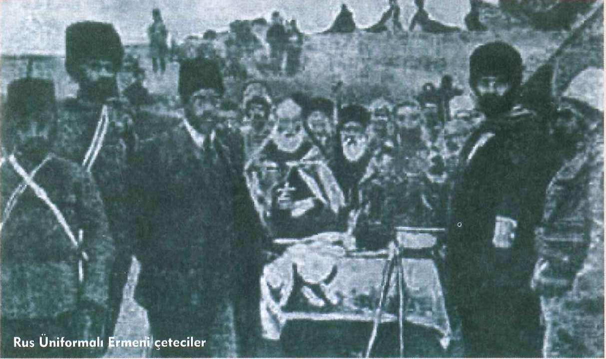
Rus Üniformalı Ermeni çeteciler

İlgilendiren bir mesele olduğunu, tabiatıyla bu konunun tarihçilere bırakılması gerektiğini, ilgili devletlerin arşivlerini de açarak tarihçilerin konu üzerinde çalışmalarını görüşünü serdetmesine rağmen Batılı devletler bildiklerini okumaya devam etmektedirler. Anlaşılan odur ki tarih ile siyaset iki ayrı meşguliyet alanı olmakla birlikte, biri öbürünün hizmetinde bir araç olarak kullanılmaktadır. Dolayısıyla ortaya çıkan sonuçlar, tarihi gerçeklikten uzak tamamen siyasi bir mahiyet kesbetmektedir.