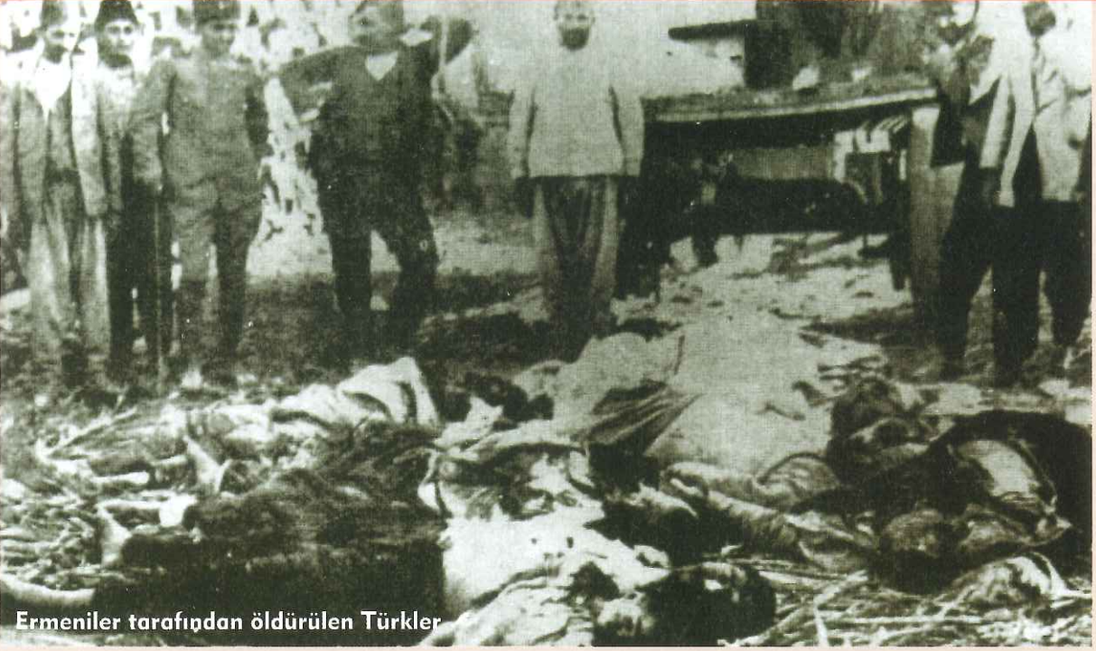
Ermeniler tarafından öldürülen Türkler

görebilmektedir. Peki bunun delili, ispatı nerededir?